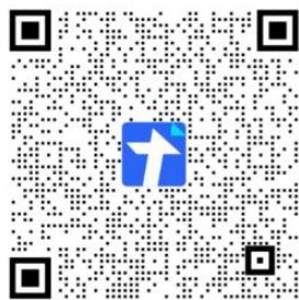
第五届电青赛报名

本次大赛可登录大赛官网（ http://www.eypic.net ）或使用微信扫描以下二维码报名。参赛选手仅限选择其中一个竞赛项参赛。为方便后期通知，提交报名后请大家加入群号 797662798 的 QQ 群。报名时间截止至 2026 年 9 月 10 日。